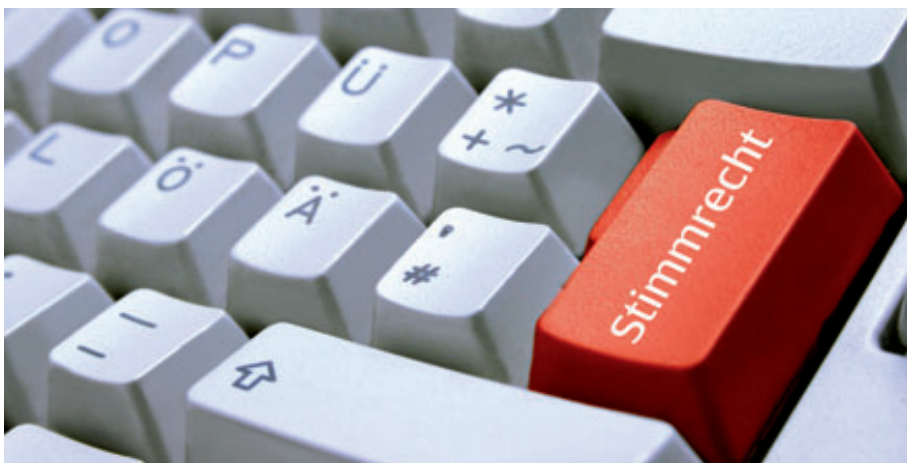
Nach dem ARUG kann die Stimmrechtsausübung direkt vom heimischen Computer aus erfolgen.

Aus heutiger Sicht bedeutet die Bevollmächtigung zur Online-Teilnahme an der HV und die Einräumung der Verwaltungsrechte erhöhten technischen und personellen Aufwand und zusätzliche Risiken (z.B. rechtlich, Hacker, Berufsopponenten) für die Gesellschaft. Aus diesem Grund gilt die Empfehlung vor allem für kleinere Gesellschaften: abwarten und beobachten.